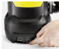
El filtro de acero protege la bomba de la suciedad gruesa