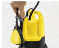
Innovador soporte y fijación de boya