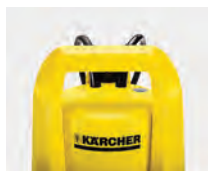
Cómoda asa de transporte