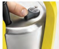
Ajuste sencillo entre el servicio manual y el modo automático