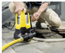
Definición continua de la altura de conexión de la bomba