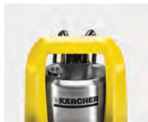
Cómoda asa de transporte