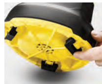
Sistema de plegado de pestañas de soporte