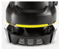
El filtro de acero protege la bomba de la suciedad gruesa