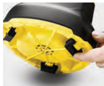
Sistema de plegado de pestañas de soporte