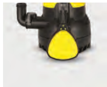
Con interruptor de boya