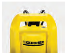
Cómoda asa de transporte