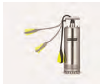
Con interruptor de boya