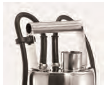
Cómoda asa de transporte