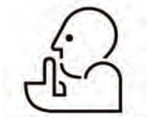
Bajo nivel sonoro