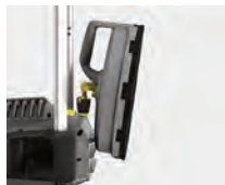
Cómodo almacenaje de accesorios