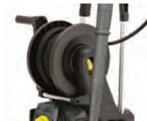
Enrollador para manguera (versión X)