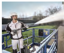
Uso vertical y horizontal