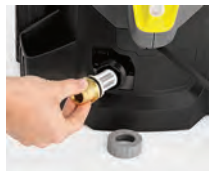
Gran filtro de entrada de agua