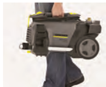
El asa de transporte integrada permite un transporte más cómodo