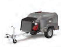
Robusto diseño para tareas de limpieza exigentes