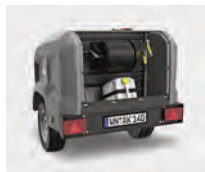
Manejo sencillo y cómodo