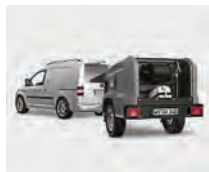
Independientes del suministro externo de corriente o agua