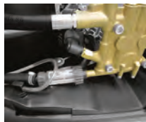
Sistema de amortiguación de vibraciones SDS