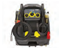
Uso fácil e intuitivo