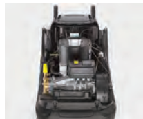
Electromotor de cuatro polos con bomba axial de tres pistones