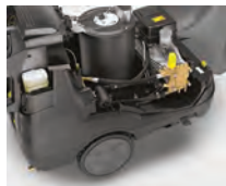
Tecnología del quemador altamente eficaz