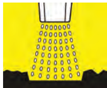
Aumenta un 40% la presión de impacto