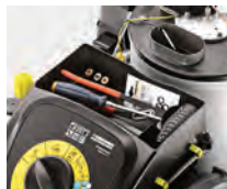
Almacenaje de accesorios