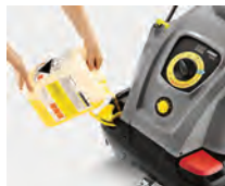
Fácil manipulado y uso